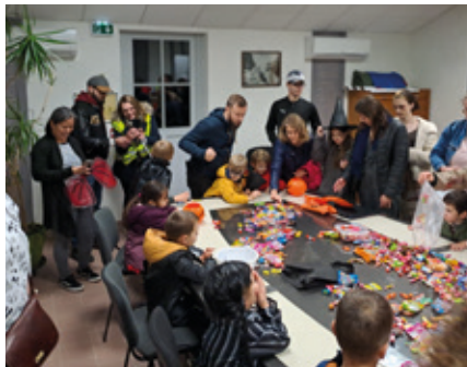
31 octobre — Soirée Halloween à Beauvais