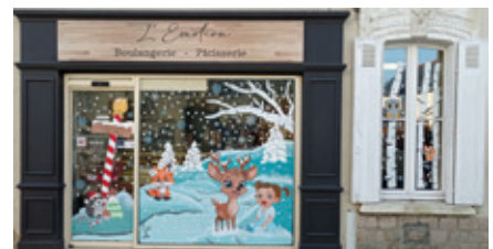
Décembre — Vitrines des commerces peintes aux couleurs de Noël