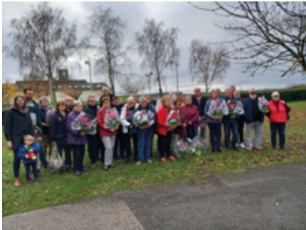
18 novembre — Remise des prix des maisons fleuries