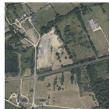
2013 : remblaiement de la décharge