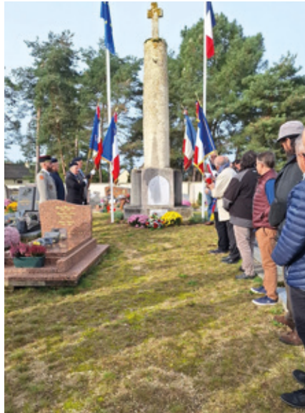
11 novembre — Cérémonie à Beauvais