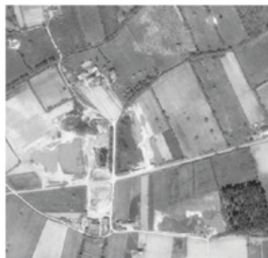
1978 : sablière en activité