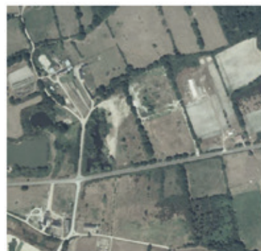
2002 : fin d'activité de la décharge