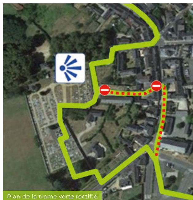
Plan de la trame verte rectifié

En page 8 du dernier Mag, nous vous présentions la Trame Verte de Jarzé. Le tracé présenté sur le plan est erroné. En effet, celui-ci emprunte « un raccourci », entre la porte haute du cimetière et la rue Louis TOUCHET, qui passe par du domaine privé. Il convient donc d'entrer dans le cimetière et d'emprunter la porte basse de celui-ci pour rejoindre la place Norbert DAVIGNON. Veuillez nous excuser pour cette erreur.