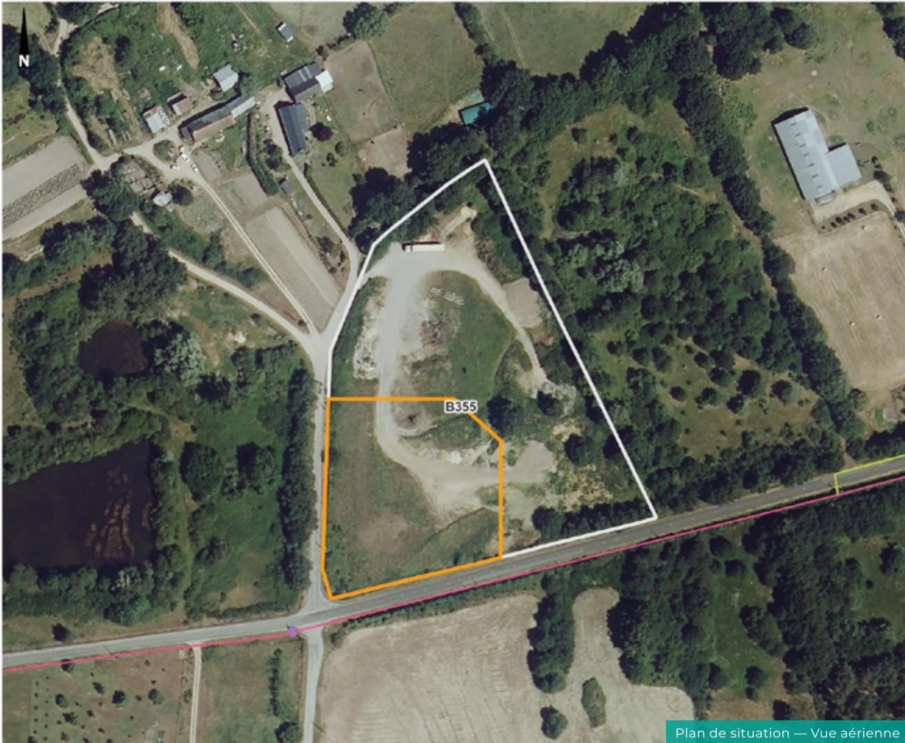
Plan de situation — Vue aérienne