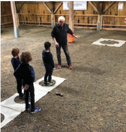
Octobre — Initiation à la pétanque durant la semaine du jeu