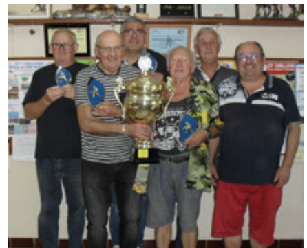
Octobre — Challenge Le Beauvallois en la Société l'union de Beauvais