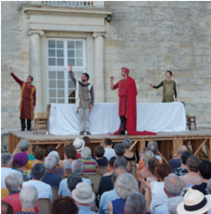
9 septembre — Gargantua du Nouveau Théâtre Populaire au château de Jarzé