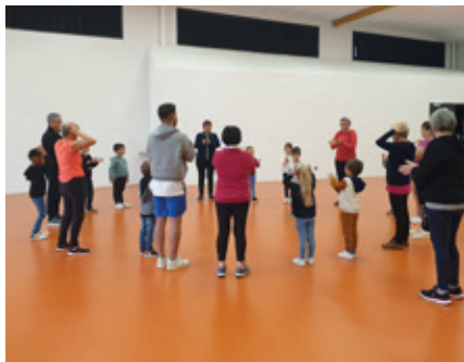
Reprise de la gym séniors, ici avec une classe de l'école Saint-Jean