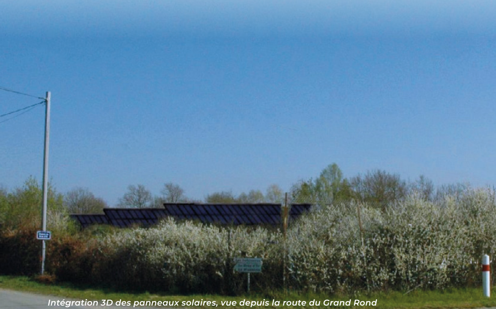
Intégration 3D des panneaux solaires, vue depuis la route du Grand Rond