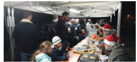
1 er décembre — Soirée illuminations de Noël