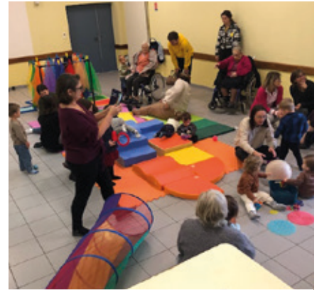
16-20 octobre — Semaine du jeu à la salle des fêtes à Jarzé