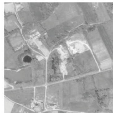
1997 : décharge