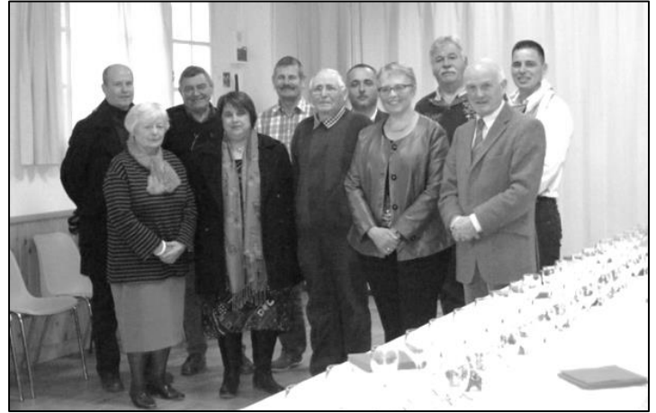
Des élus de Lué et Jarzé et des présidents d'associations

Les 80 personnes présentes ont ensuite partagé la galette.