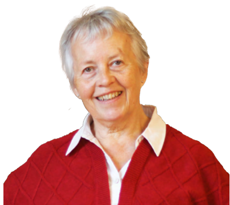
MAIRE DE JARZÉ VILLAGES

Dans une commune, le maire est un agent exécutif de la commune et représentant de l'État.