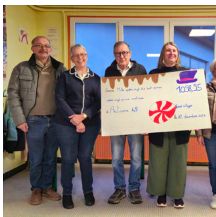
20 janvier 2026 Remise de chèque à Autisme 49