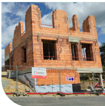
16 avril 2026 Construction de la nouvelle mairie