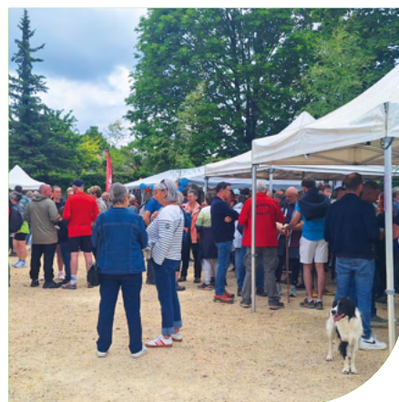
10 mai 2026 Fête du Muguet à Lué-en-Baugeois