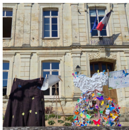
19 mars 2026 Grande Lessive®