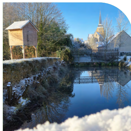
6 janvier 2026 Neige à Jarzé Villages