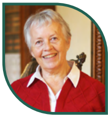
Élisabeth MARQUET Maire de Jarzé Villages Jarzé