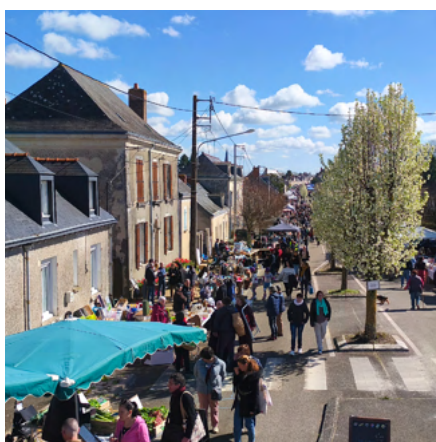
15 mars 2026 Vide-grenier à Jarzé