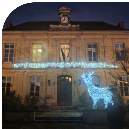
Décembre 2025 Illuminations de la mairie