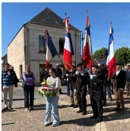
8 mai 2026 Commémoration du 8 mai 1945