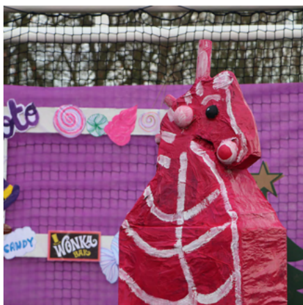
12 décembre 2025 Soirée de Noël